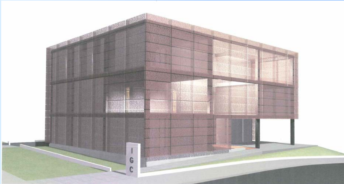
Imatge del futur Centre de l'IGC a Tremp